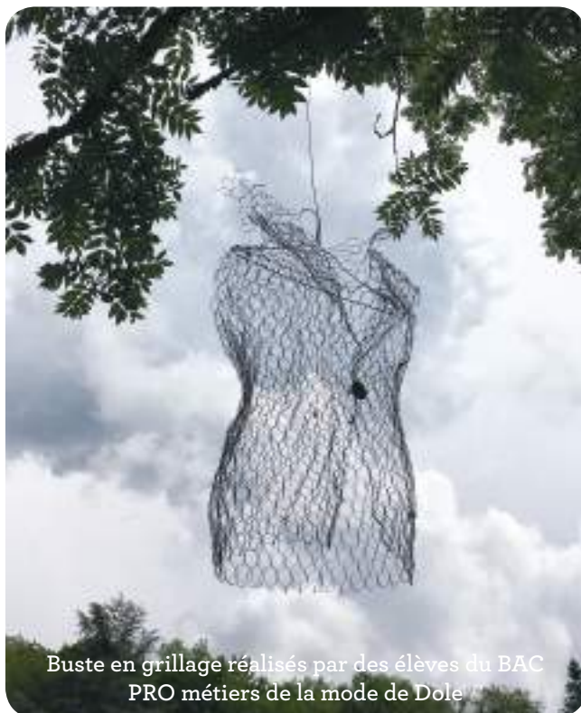
Buste en grillage réalisés par des élèves du BAC PRO métiers de la mode de Dole